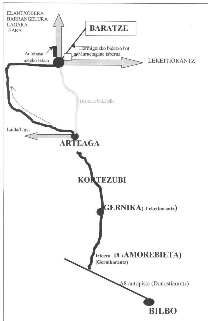
1. irudia: Baratze Baserri-Eskolara heltzeko mapa